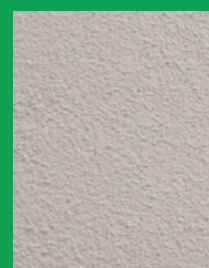
KEIM UNIVERSALPUTZ 1,3 mm