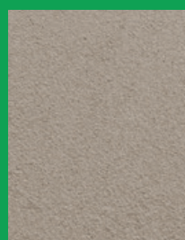
KEIM NHL-KALKPUTZ-FEIN 0,6 mm