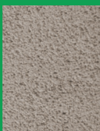
KEIM NHL-KALKPUTZ-GROB 3 mm